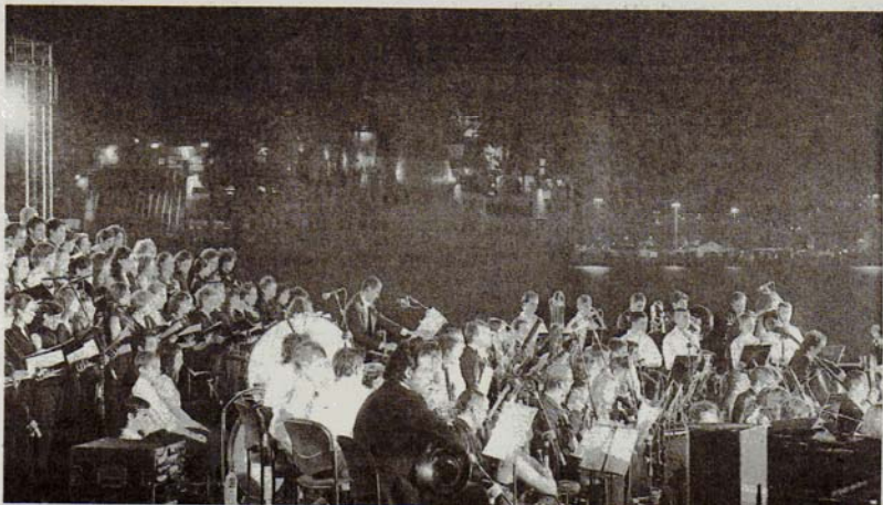
ORIGINALIDAD. El barco procedente de Nador rodeó el escenario al entrar al puerto.