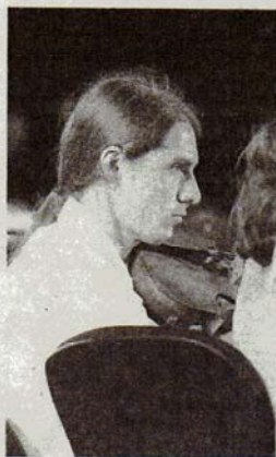
Intérprete de la Joven.

Unas cinco mil personas siguen el 'Carmina Burana' que ofrecieron la Orquesta, la Orquesta Joven y el Coro Ciudad de Almería en el Muelle de Poniente