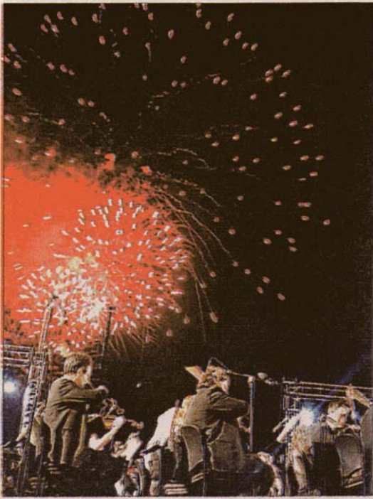
Los fuegos artificiales convirtieron el Muelle de Levante en un espacio mágico. #L