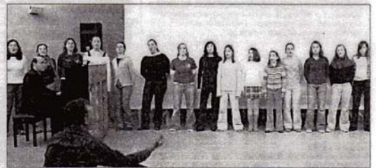
BANDA SONORA. Xiquets Cantors Divisi participaron en la película.