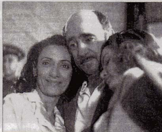
La familia. La madre, el padre y la hermana del niño.