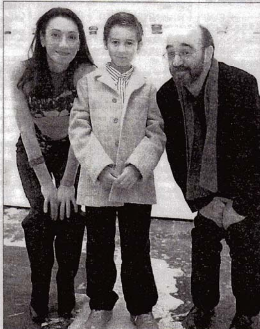
PROTAGONISTAS. Rosana Pastor, Pablo Gómez y Álex Angulo.

■ Su padre se inventa una realidad más amable que se rompe en añicos