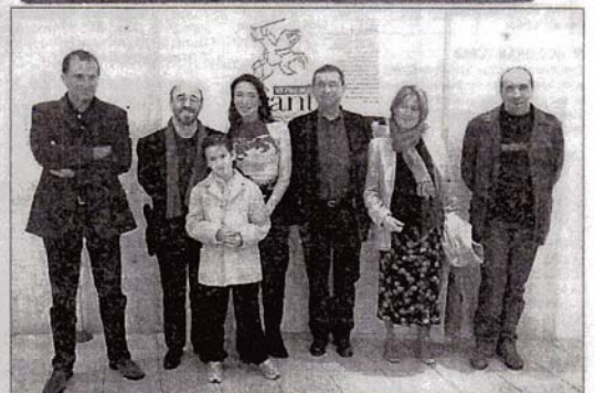
FOTO DE FAMILIA. Actores y productores, en el Club Diario Levante.